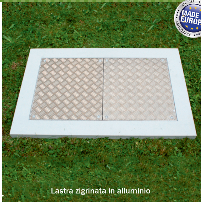
Lastra zigrinata in alluminio